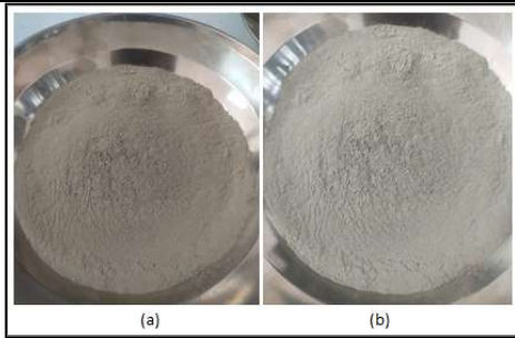
Gambar 1. (a) Fly Ash (b) Semen